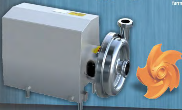
IPC - A