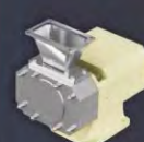
Tolva de aspiración