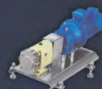
Convertidor de frecuencia