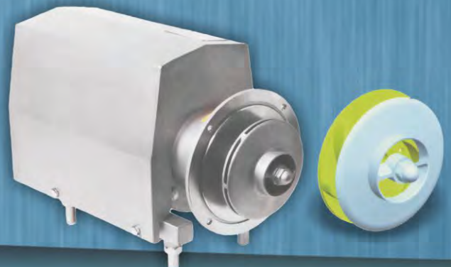
IPC - C

Cuerpo AISI 316 fundido (opcional 304). Conexión: rosca racord DIN (opcional BSP, SMS, RJT, IDF, Clamp DIN32676, 3A, ISO). Estanqueidad por cierre mecánico estándar; opcional refrigerado. Juntas estándar EPDM (FDA); opcional VITON o NBR. Pulido interior: Ra ≤ 0.8 µm. Acabado exterior: pulido espejo o mate. Rodete en acero inoxidable fundido abierto (IPC-A) o cerrado (IPC-C).