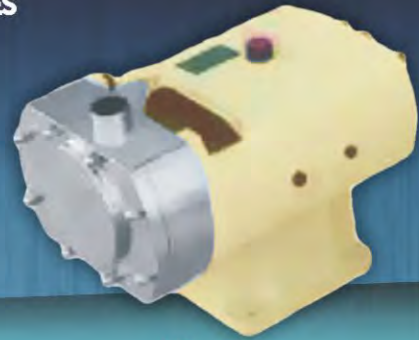
IPL - V (VERTICAL)