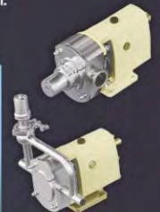
Válvula de seguridad